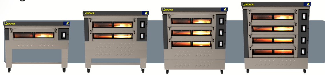
FABRICADO SISTEMA MODULAR, COMPOSIÇÃO DE ATÉ 04 CAMARAS

BRASFORNO INDUSTRIA E COMÉRCIO LTDA RUA RIO DE JANEIRO, 834 - SANTANA DE PARNAÍBA - SP (11) 4705-9555 - CEP- 06530-020 - CNPJ 68.947.308/0001-82 www.brasforno.com.br - instagram @brasforno